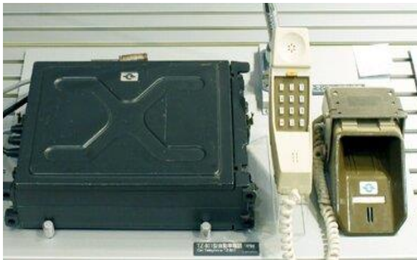
TZ-801形2号自動車電話機 (NTT技術史料館 3階展示品)