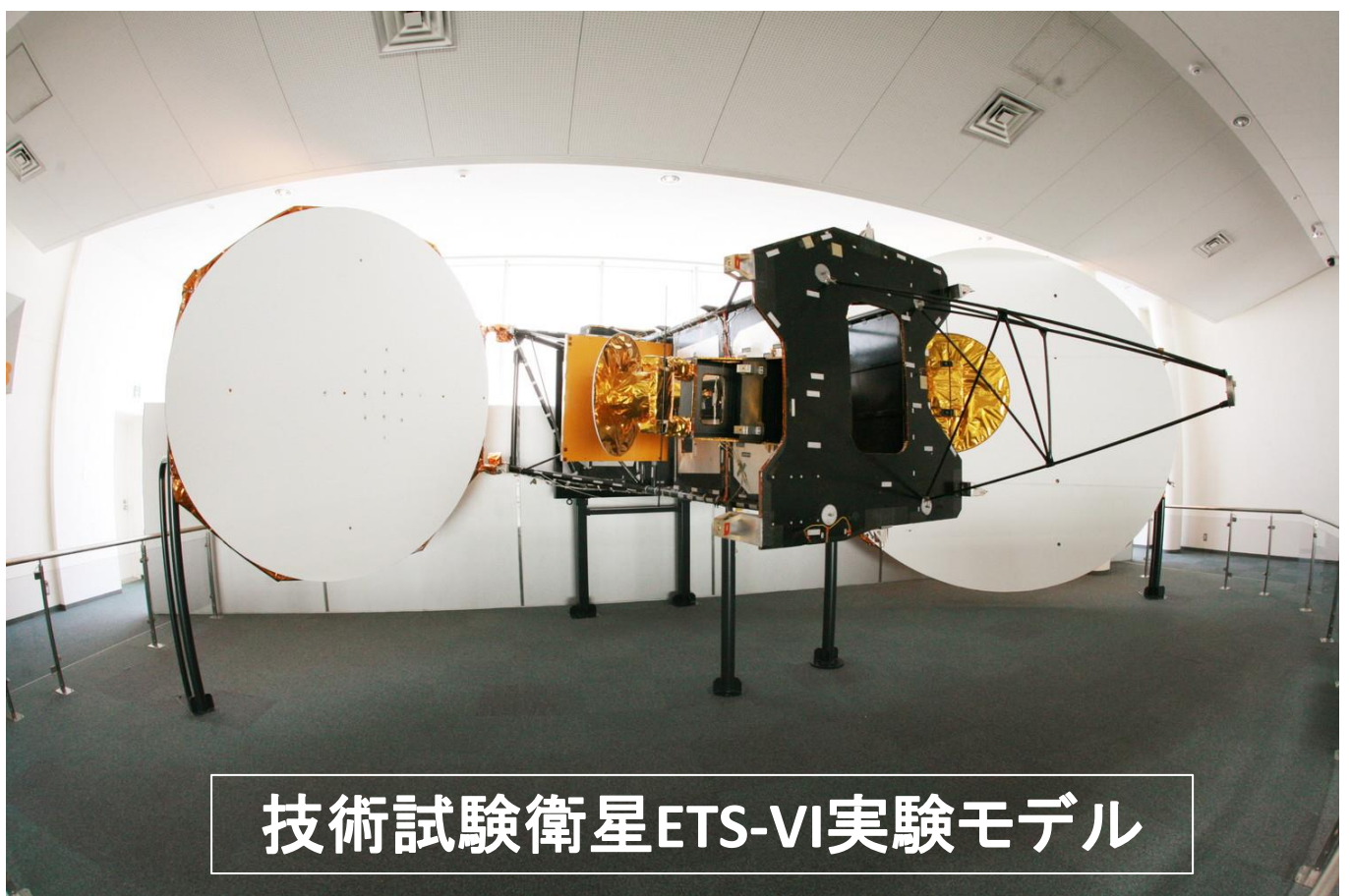
技術試験衛星ETS-VI実験モデル