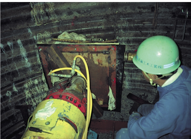
非開削工事の様子

管路、とう道などの土木工事で発生する建設発生土、建設廃棄物の抑制のために、従来の開削工事を1985年から エースモール などの非開削工法を導入してきた。1993年には、建設発生土を改良・再利用するシステムを開発することにより、建設発生土のリサイクル促進に取り組んでいる。