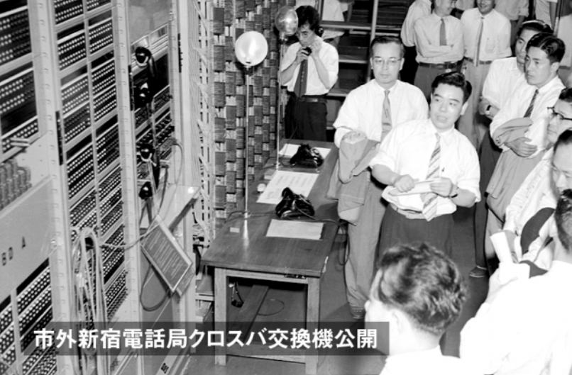
市外新宿電話局クロスバ交換機公開